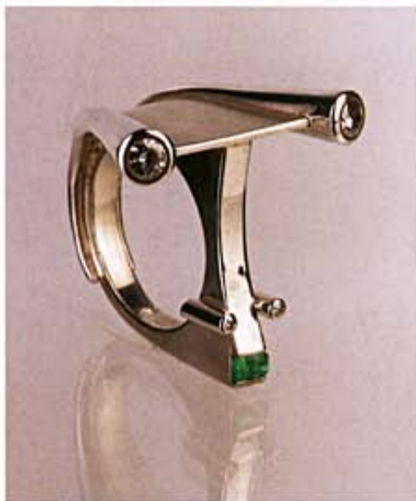
脾氣古怪的傢伙—925銀、鑽石、祖母綠 限量10件